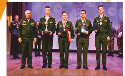
Победители олимпиады по английскому языку