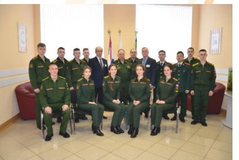
Победители олимпиады по химии