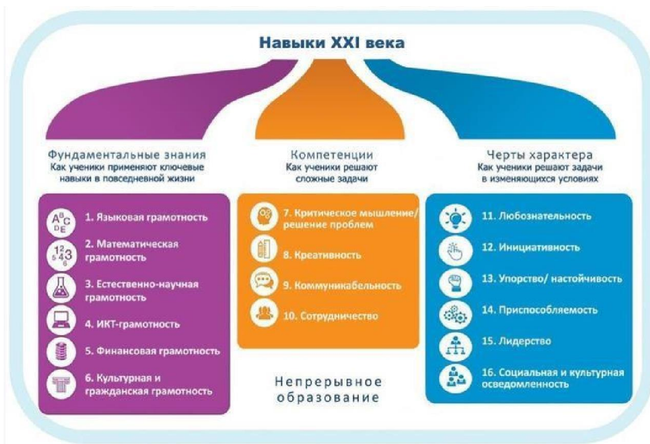
Рисунок 1. Образовательная модель World Economic Forum

С целью решения этой проблемы проектной группой Всемирного экономического форума была разработана и представлена в докладе «Новый взгляд на образование» модель, включающая в себя три типа образовательного результата: знания предметных областей с акцентом на функциональные грамотности, включая ИКТ-грамотность, компетенции 4К и качества характера.