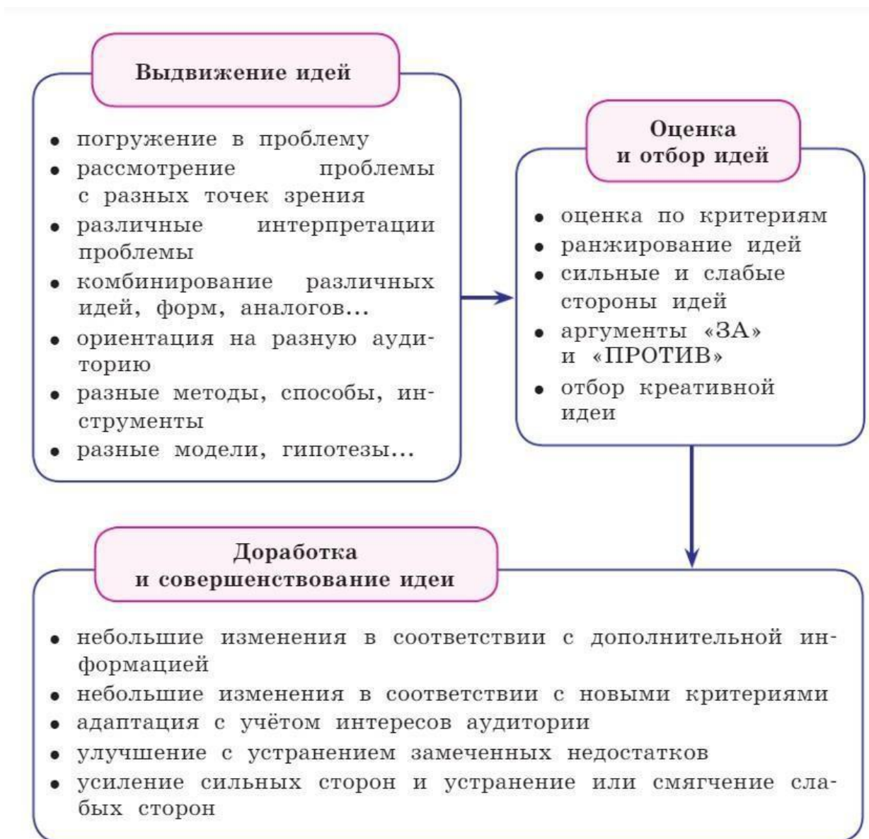
Рисунок 2. Действия, требуемые при выполнении заданий на креативность

Алгоритм работы с учебной ситуацией или учебной задачей описан Г.С. Ковалёвой, О.Б. Логиновой и др. в учебном пособии для общеобразовательных организаций «Креативное мышление. Сборник эталонных заданий» 1 и представлен на рисунке 2.